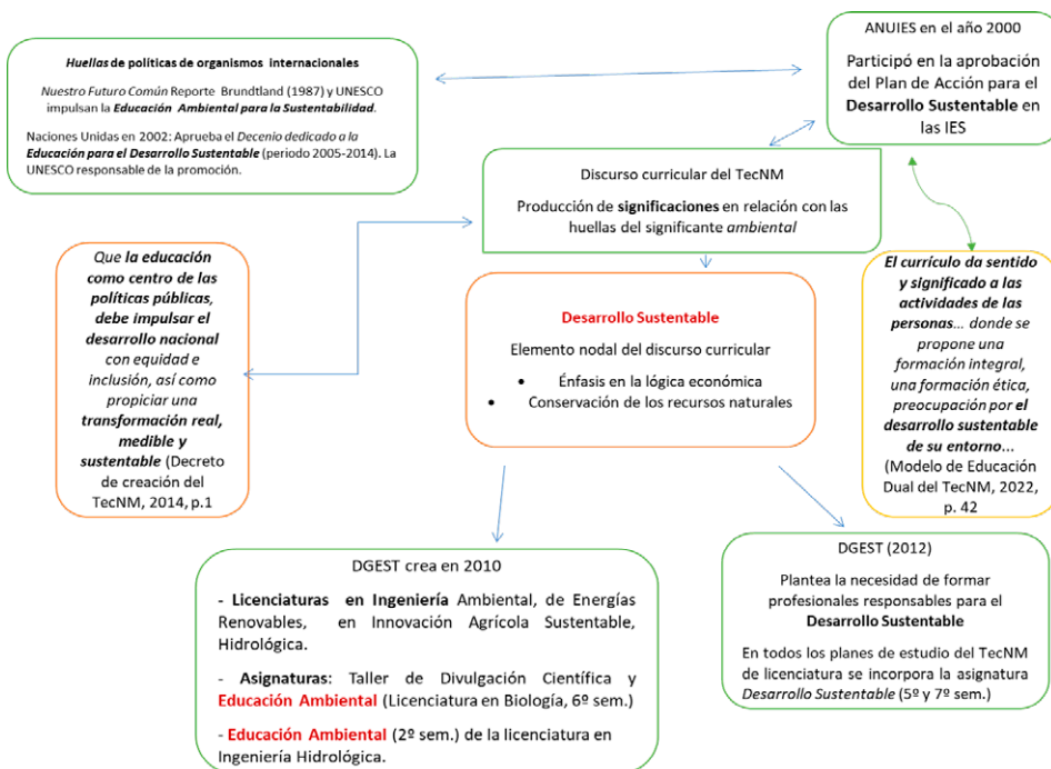
Figura 3. Procedencias y emergencias del DS en el discurso curricular del TecNM